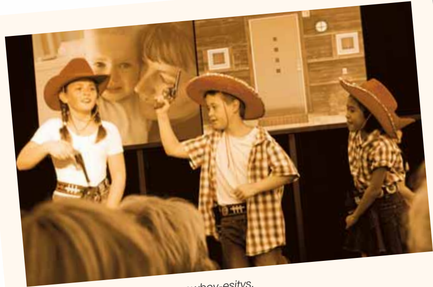
Avajaisjuhlassa nähtiin lasten cowboy-esitys.

Maailmalle norjalaiset ovat rakentaneet kymmeniä lapsikyliä ja edelleenkin Norja on yksi vahvimpiä kansainvälisen SOS-lapsikylätyön tukijoita ja toteuttajia.