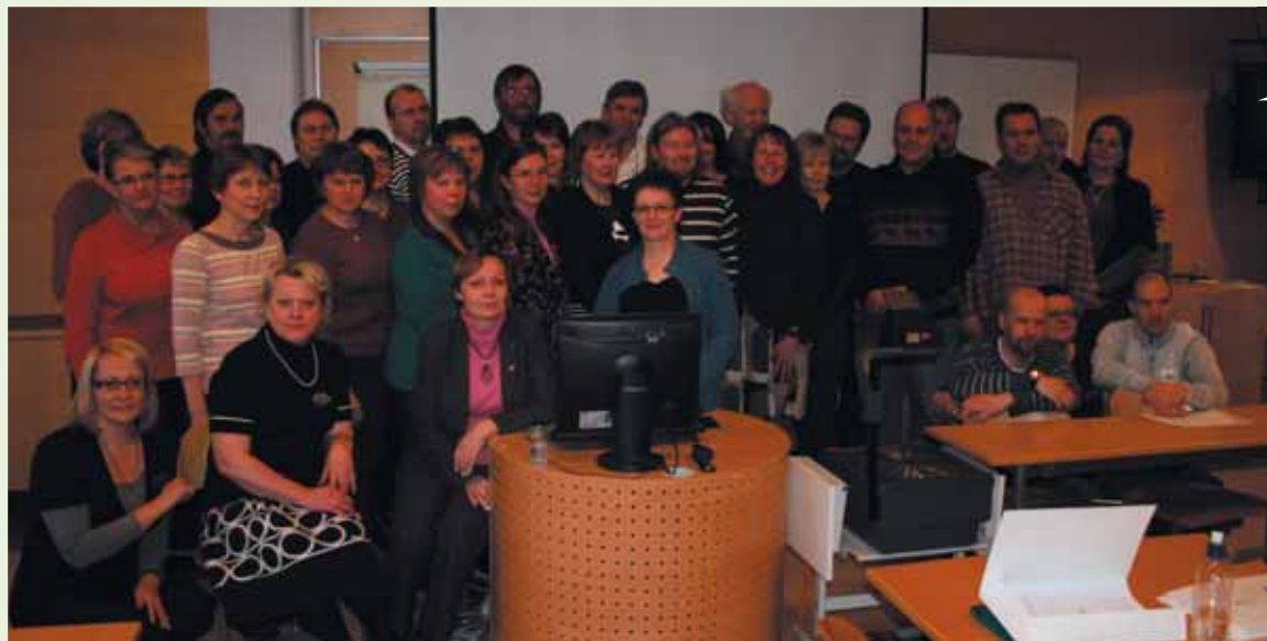
Kiertokoulu kokoontui ensimmäisen kerran 28.1. Oulussa